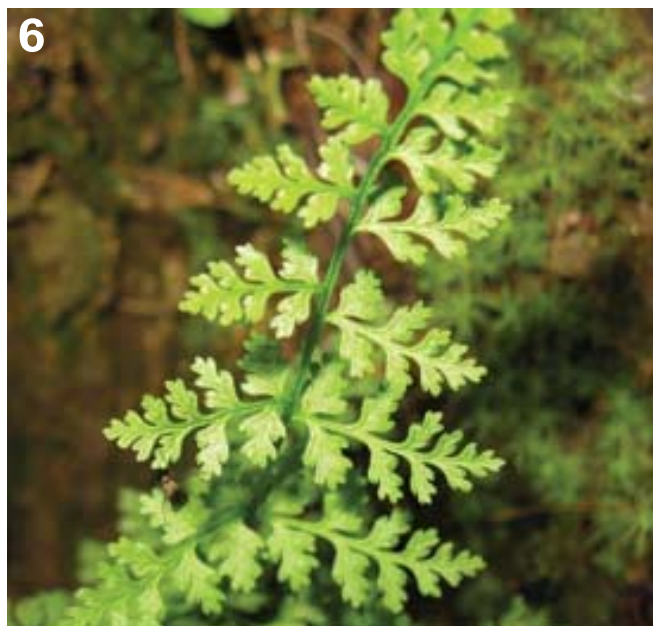
Figur 6. Kalkinnslag er altså en forutsetning for en rekke krevende planter, som for eksempel kalkklok Cystopteris alpina .

Mange av de registrerte storsoppene i Holmvassdalen danner en eller annen form for mykorrhiza. De utvikler symbiose med mose eller røttene på trær, planter, lyng og busker og er derfor avhengige av bestemte vekster for å kunne etablere seg. Men forekomstene dør ut dersom skogen flatehogges uten at en viss mengde levende røtter på vertstreet står igjen (Kålås et al 2006:110). Mye tyder på at mykorrhizasopp er representert med størst mangfold på kalkgrunn (Ødegaard et al. 2005), men slike boniteter er også de mest lønnsomme for skogbruket, siden veksten og trærnes dimensjoner vanligvis er størst her. Kalksopp knyttet til barskog har av den grunn vært i tilbakegang som følge av omfattende flatehogst i tiårene etter andre verdenskrig (Kålås et al. 2010a: 98). Store arealer gammel kalkskog er gått tapt og ungsbogen som