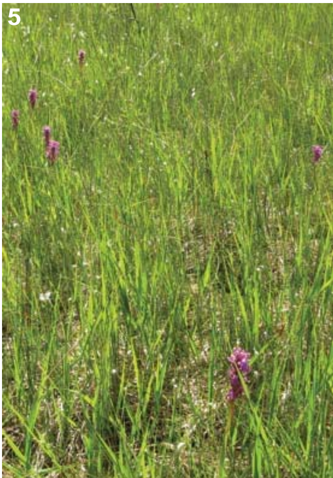
Figur 5. Kalkmyr med lappmarihand som indikator på artsrikhet. Rich fens with Dactylorhiza lapponica as an indicator of species diversity.

nedenfor kalkårer/kalkbenker. Markvatn og sigevatn fra rikkilder fordeler seg utover myrene og gir høy pH. Dette gir også gunstige habitater for krevende sopp, særlig for sjeldne og rødlistede arter i slekta Entoloma (Lorås & Eidissen 2011:49).