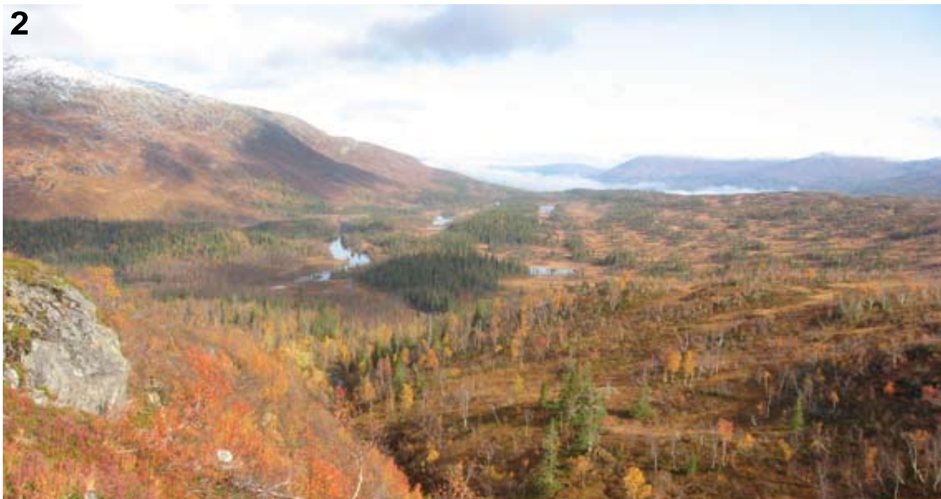
Figur 2. Øvre del av Holmvassdalen naturreservat, med lange strekninger med gran-, furu- og bjørkeskog. Upper part of Holmvassdalen Nature Reserve, with long stretches of spruce, pine and birch forest.

areal av landets produktive skoger er stadig økende og utgjør nå over 50 % (ibid.:95). Gammelskogen erstattes fortløpende med produksjonsskog og over tid skaper dette omfattende økologiske endringer med store tap av biologisk mangfold. I dag er kun 1 % av den biologiske mest betydningsfulle skogen 160 år eller eldre (Larsson & Hysten 2007:30). Dette forholdet rammer også naturtyper i skog, som utarmes biologisk som en konsekvens av denne utviklingen.