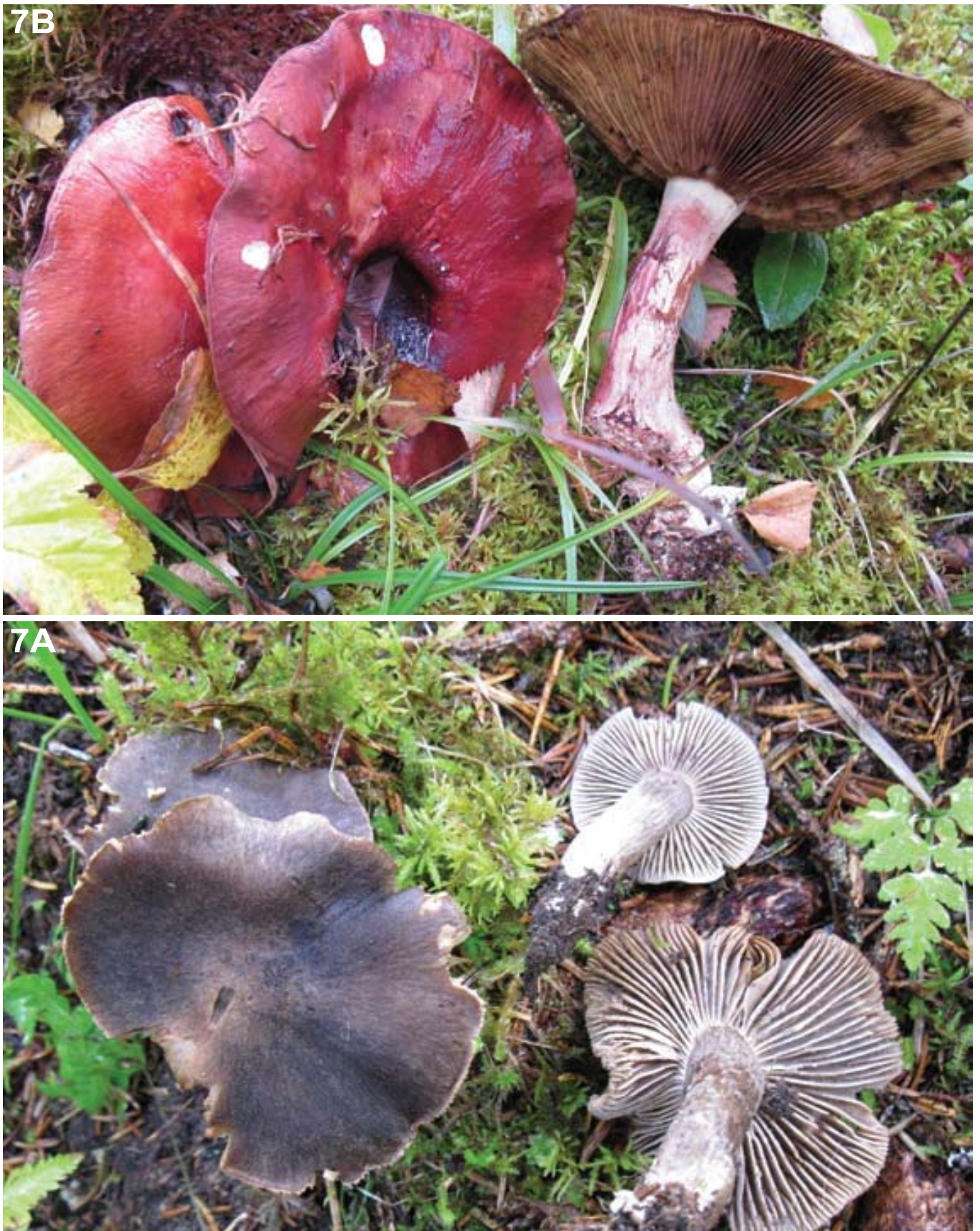
Figur 7. A Kopperrød slørsopp er funnet på flere enn ti lokaliteter i kalkgranskogen i reservatet. B Tricholoma borgsjoeense , en svært sjelden og rødlistet musserong, danner mykorrhiza med gran i Holmvassdalen. A Cortinarius cupreorufus has been found at more than ten localities in calcareous spruce forest within the nature reserve. B Tricholoma borgsjoeense , a very rare and red-listed knight-cap mushroom, forms mycorrhizae with spruce in Holmvassdalen.