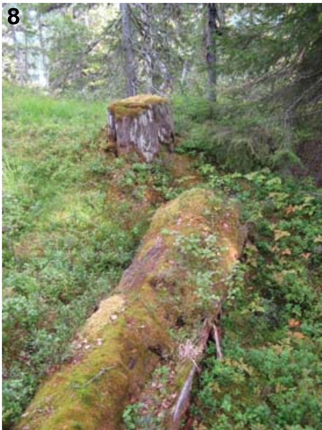
Figur 8. Rester av urskog, som Engelskbruket ikke klarte å ta hånd om. Remnants of old growth forest that 'The English company' failed to exploit

Opplysninger tyder utvilsomt på at dimensjonshogst var det ledende prinsipp for avvirkningen, siden virke til papirindustri ennå ikke kunne leveres. I følge beregninger gjort av forstkandidat Einar Grannes innebar Engelskbrukets hogstform at minstemålene som gjaldt, tilsa en diameter på 13 cm i toppen på en fire meter lang stokk (Grannes 1996). Gjennomsnittlig avsmalning på treet er 1,5 cm/m og stokken vil da være 16 cm i diameter på midten og 18 cm i diameter 1,3 meter over bakken. Grannes skriver at det neppe kan betegnes som rasering når så store trær ble etterlatt. Dimensjonshogsten tilsier derfor at mange arter overlevde i motsetning til prinsippet om flatehogst. Mykorrhizasopp fant nye vertstre om det gamle ble hogd og kontinuiteten kunne dermed opprettholdes. I tillegg var stubbene etter Engelskbrukets hogst ofte høyere enn under flatehogstbruket, som førte til at mer død ved ble tilbake. I 1920-åra kunne nye skogdrifter settes i gang i Holmvassdalen på grunnlag av den skogen som Engelskbruket satte igjen. Det kunne ikke ha vært gjort dersom den minste skogen også hadde