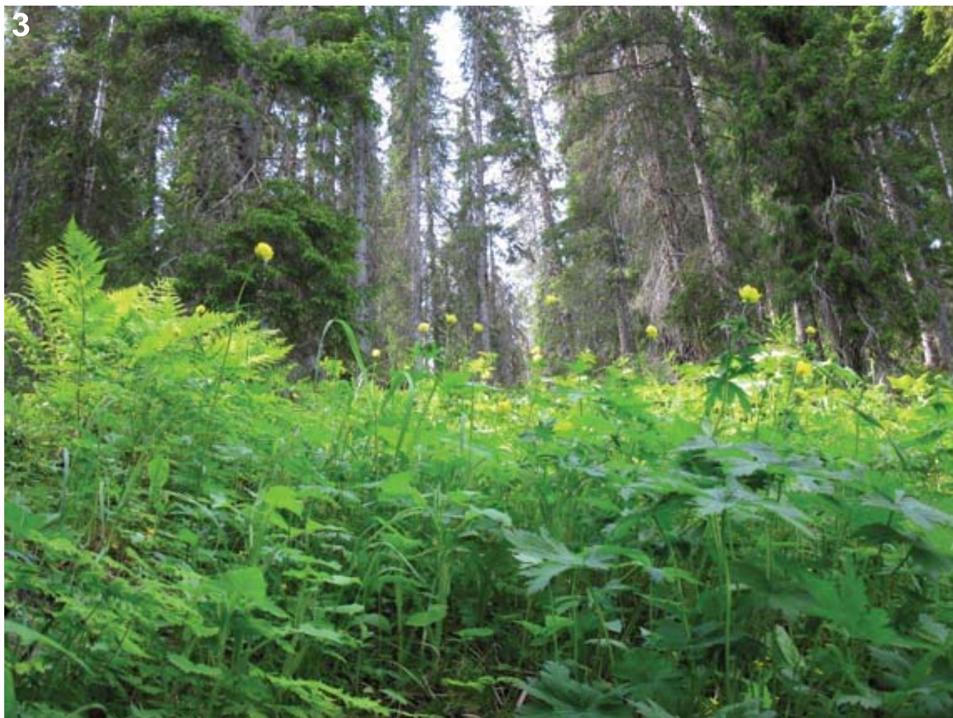
Figur 3. Høgstaudeeng i gammel grankalkskog. Meadow with tall-herbs in ancient calcareous spruce forest.

nen sammensetning av arter. De benevnes som lågurt-grankalkskog, rødlistet som VU ((Lindgaard & Henriksen 2011:92), og ligger som regel mer åpent enn høgstaudeengene. De kan imidlertid være helt trebevokst, men i Holmvassdalen er mange av engene fattige på trær. Naturtypen har mange likheter med lunder og edelløvskoger (Nitare 2011:42).