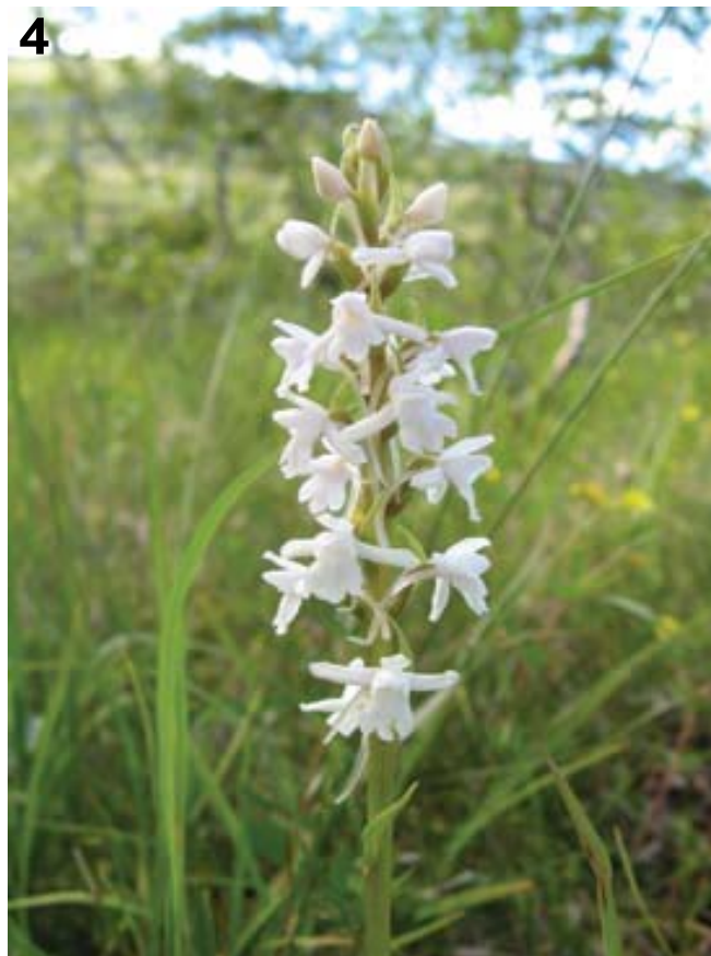
Figur 4. Hvit variant av brudespore. A white variant of Gymnadenia conopsea .

Funn av mye lappmarihand og engmarihand betyr at naturtyper som rikmyr/kalkmyr og