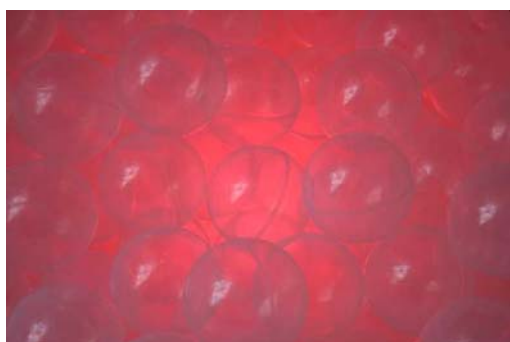
Ballbassenget (rødt rom)