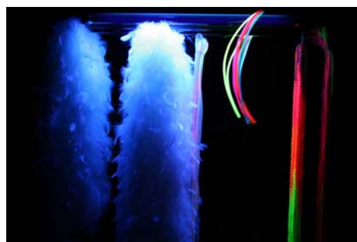
Fra det svarte rommet