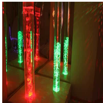
Fra det hvite rommet - løvstolen og boblesøylene