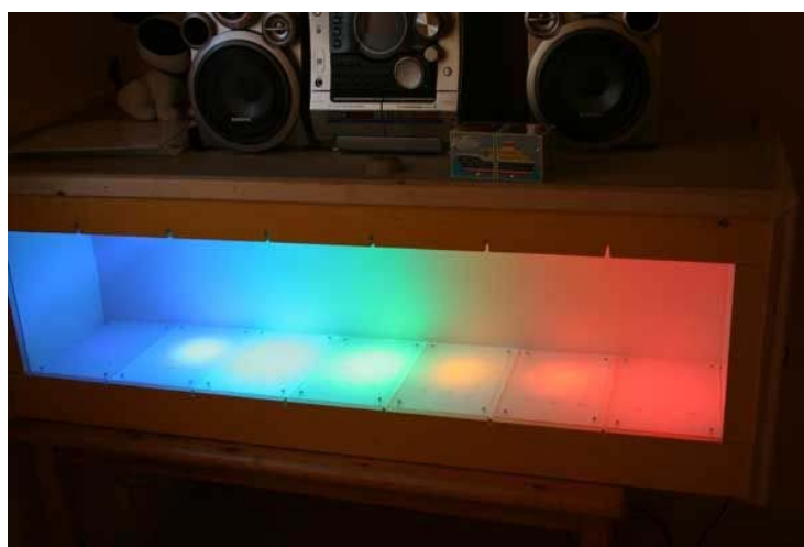
Lysorgelet på det gule rommet - musikkrommet