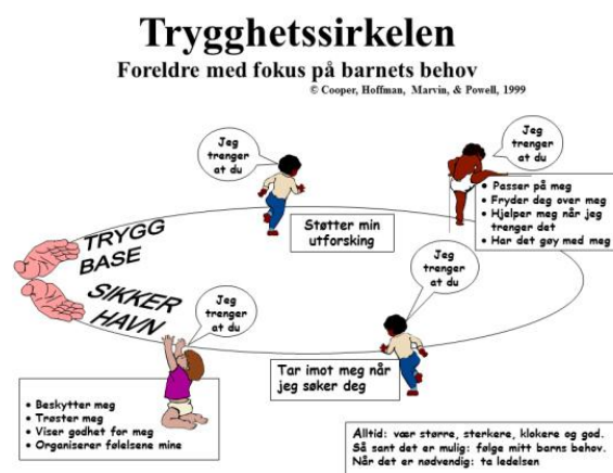
figur 1: Trygghetssirkelen (Broberg m.fl 2014:44)

Her er det snakk om den voksnes kunnskap innenfor relasjonskompetansen. At den voksne vet hvordan barnet kan bli påvirket om det er en utilgjengelig voksen, og hvordan det kan påvirkes hvis man er en tilgjengelig voksen. Begrepene trygg base , sikker havn , er sentrale innenfor tilknytningsteorien, og som beskriver to sider av den voksnes evne til å vise omsorg (se Figur 1 om trygghetssirkelen. Broberg m.fl 2014:44).