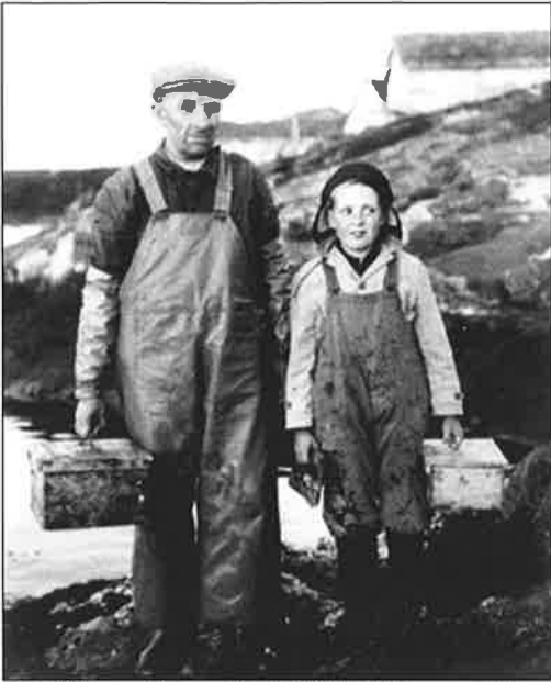
Nord-Norge planen fra 1952 hadde som mål at den oppvoksende generasjon skulle over i lønnsarbeid, fordi fiskarbonden ble oppfattet som en bremse i utviklingen av landsdelen. 1957 Træna.