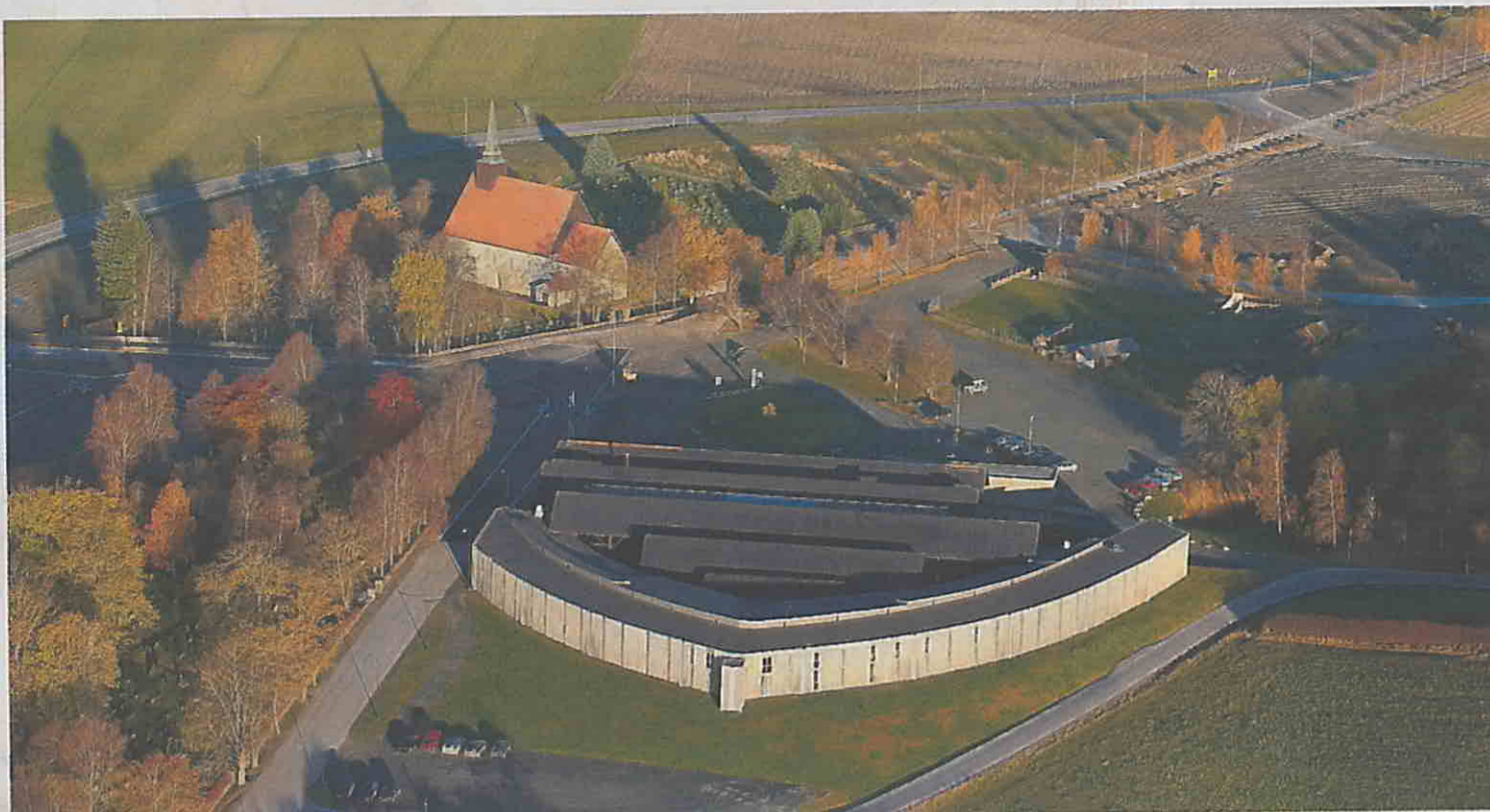
Stiklestad: - Uten N-T fylkeskommune og de kulturpionerene som er nevnt ovenfor, ville Nord-Trøndelag i dag neppe hatt hverken Musikk i Nord-Trøndelag, Nord-Trøndelag Teater, Fylkesgalleriet i Namsos eller Stiklestad Nasjonale Kultursenter, skriver kronikøren.