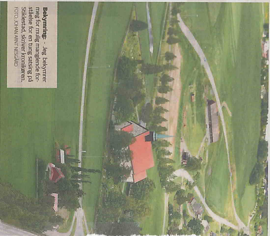
Bekymring: - Jeg bekymrer meg for mulig manglende forståelse for en tung satsing på Stiklestad, skriver Kronikkøren.

Kommunereformdiskusjonen handler i for stor grad om kommunal tjenesteproduksjon. Et sentralt punkt, selvsagt, men ikke det eneste. Like viktig er spørsmålet om hvordan reformen påvirker lokaldemokratiet. Et aktivt lokaldemokrati har mange byggesteiner; lokal identitet og tilhørighet, nærhet mellom de som styrer og de som blir styrt, kommuneestorrelse. Det er nært å tro at dette er enkle utfordringer å løse når to kommuner av omtrent samme størrelse og med hver sine særprege, historie og