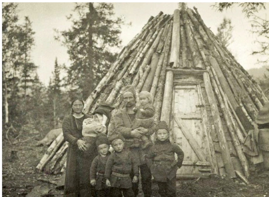
En reindriftsfamilie og den nybygde kåta ved Majavatn i 1916.

å vurdere den samiske måten å innrette seg på, og forstod ikke hvor praktisk og komfortabelt det kunne være å bo i ei kåte. Slike mindre episoder var del av en langsiktig fornorskning, som fulgte i kjølvatnet av Finnemisjonens nærvær.