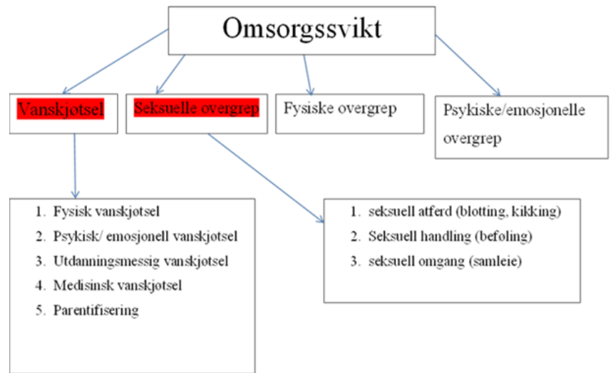
Figur 2. Figuren viser begrepet omsorgssvikt, og de ulike undergruppene jeg velger å dele det inn i.

hentet fra Carolina Øverlien (2015), Stine Sofie stiftelsen (2012) og Øyvind Kvello (2015).