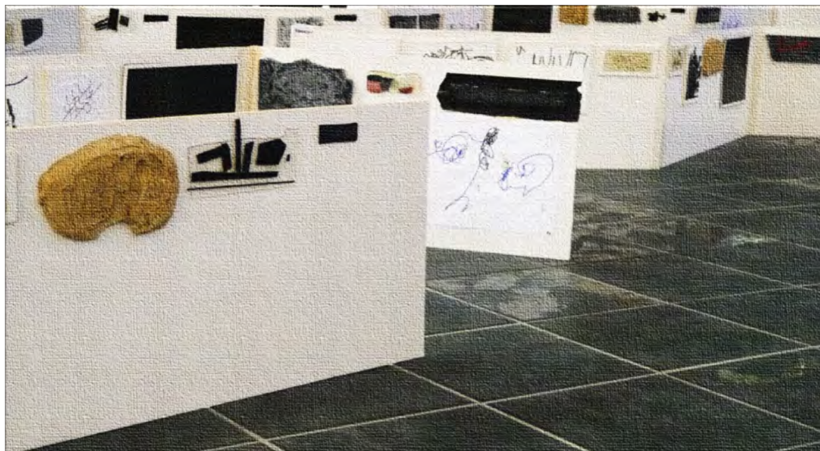
Bilde 4. Fotoutsnitt av trekkspillformasjoner slik de kunne sees fra golvflatens perspektiv

Andre utstillingskomponent var skrivelek-produkter presentert gjennom ni trekkspillmontasjer i Kapafix, utstilt i sentrum av foajeens gulvflate. Gulvflater kunne forbindes med små barns romlige oppdagelsesferder de første leveårene. Ved å ta i bruk en utstillingsflate som inviterte til et lavt seerperspektiv, ville fysisk avstand mellom deltakere og deres utstillingsbidrag