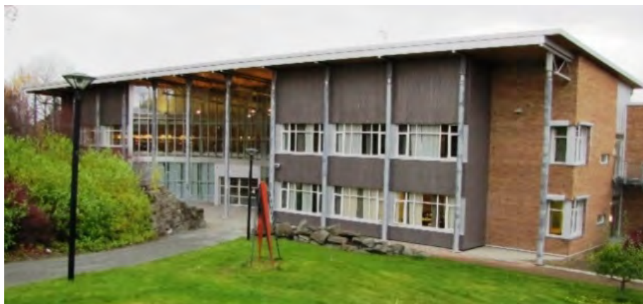
Bilde 1. Den ytterste eska: Fasade med inngangsparti av Nordlåna, Nord Universitet, Levanger.