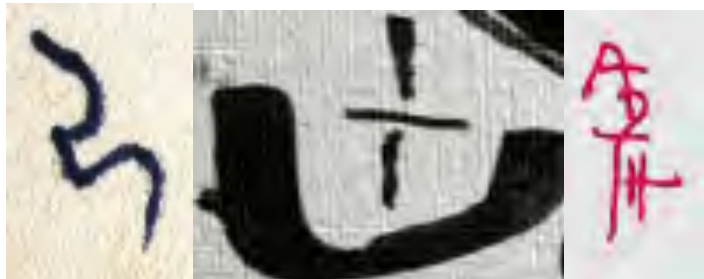
Bilde 6: Eksempler fra tegnmakernes skrifttegnunivers, som separat og samlet framstår som estetiske formasjoner.

barn, i formelle kurs- og fagdager i barnehage, skole og universitet. Maksimalistiske forstørrelser av skriftformasjoner kunne blitt trykt på plakater og tapet, på tekstile materialer som sengetøy og klær, samt på et reklameskilt ved prosjektbarnehagens inngangsparti. Hva med en tatovering?