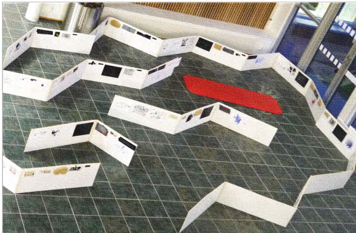
Bilde 3. Oversiktsfoto med utsnitt av foajeen og trekkspillformasjoner (hver plate i formasjonen måler 100 x 30 cm)