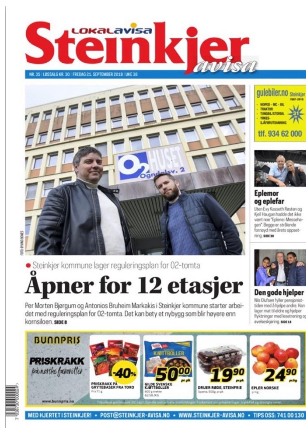
Figur 4: Nye Steinkjer-Avisa

Den nye Steinkjer-Avisa ligner veldig på den gamle Steinkjer-Avisa. Logoene har imidlertid blitt sammenslått. Over Steinkjer-Avisa-logoen, står den gamle Lokalavisa-logoen. Side 2 og 3 er lik gamle Steinkjer-Avisa, med spalta folk og navn, en liten nyhetssak og notiser. Verran-ordførereens gjøremål har imidlertid blitt satt inn sammen med Steinkjer-ordførereens gjøremål i spalta Ordførereens uke. Side 4 og 5 er merket med «Nyheter». Slik var det også i den gamle Steinkjer-Avisa. Den eneste forskjellen er at designet på bokstavene er blitt byttet ut. På de neste sidene kommer saker i form av nyhetsartikler, reportasjer og notiser. Midt i avisa kommer spalten «Steinkjer-sidene». Over to sider har avisa spaltene «Steinkjer-Avisa for 25 år siden», og et petit skrevet av spaltist eller ansatte i avisa. Nytt for disse sidene etter fusjonen er Dyrlegespalta og Hjemflytteren. Dyrlegespalta er skrevet av veterinærer fra Steinkjer Dyreklinikk og denne spalta blir etter hvert i min undersøkelsesperiode avlastet av