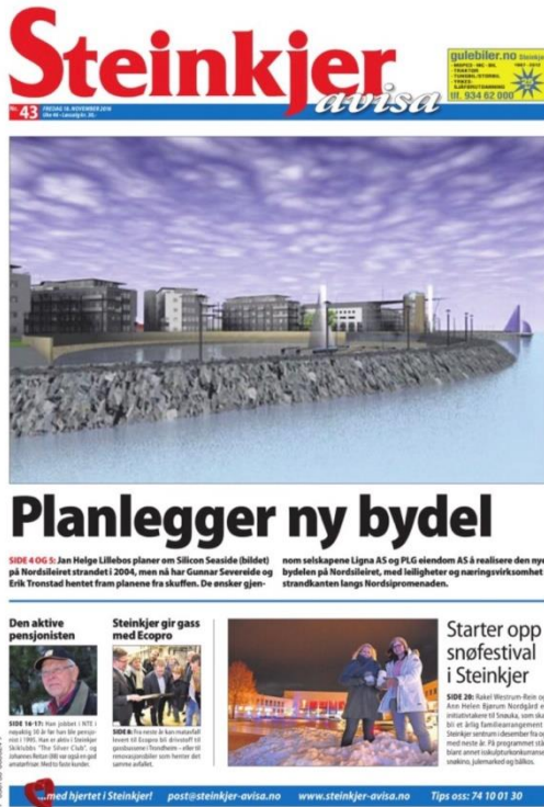
Figur 3: Gamle Steinkjer-Avisa