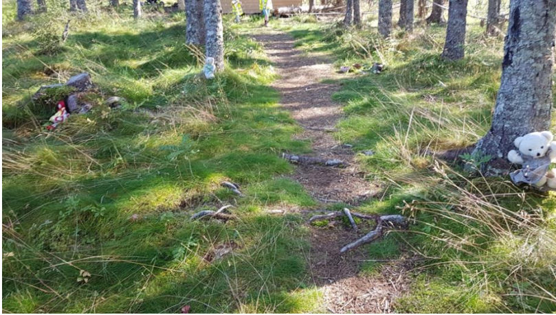
Gullhår og de tre bjørnene leker gjemsel i skogen

Noe som gjorde dette prosjektet spennende for faglærer i STM er at studentene her tok utgangspunkt i det de har jobbet med i de enkelte kunnskapsområder, fortellerkurs og didaktikk. Under utprøving fikk de selv se hvordan barn lar seg inspirere til å skape egne aktiviteter og fortellinger med utgangspunkt i studentenes fortelling.