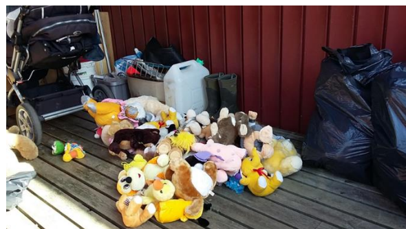
På besøk i Bamseskogen på Løkta april 2018

I april dro studentene sammen med Yvonne Langfors og studieleder for BLU, på besøk til Løkta for å bli kjent med området slik det ser ut uten bamser. Bilder av fjorårets Bamseskog