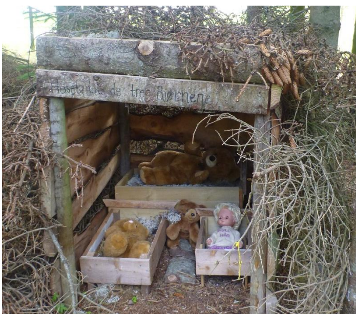
Gullhår og de tre bjørnene

Vi gikk gjennom skogen og så på de ulike utstillingene med bamser, det var et kommunestyremøte, et sangkor, et sykehus med bamser og andre kosedyr som ventet på behandling av knekte bein eller med sår i hodet og mye mer. På en liten høyde i utkanten av skogen lå en gapahuk med mange sitteplasser rundt et bord. På veggene var det bilder av bamser, samt bøker med blant annet historier om Ole Brumm og vennene hans. Vi så mange muligheter med tanke på å gjøre endringer og det som vi ble mest opphengt i, var å gi barn som kommer på besøk større muligheter til å gå inn i lek i de ulike utstillingene. For eksempel var det et tablå med Gullhår og de tre bjørnene – det var en utstilling, der det ikke var plass for at barn kunne gå inn og leke dette eventyret.