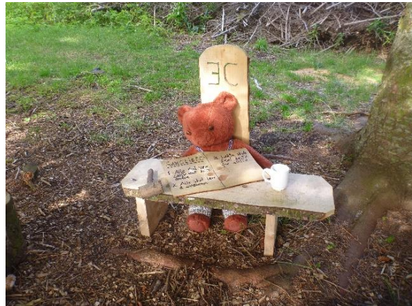
Kommunestyremøte i Bamseskogen