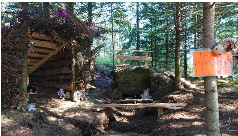
De tre piggsvinene som skulle til fjells (gruppe 4)

De forskjellige studentgruppene har alle løst oppgaven forskjellig. De ulike tablåene bar preg av ulike studentgrupper, og de ideene de fikk da de valgte område. To av gruppene valgte å ta utgangspunkt i eventyr, Gullhår og de tre bjørnene var enkel å overføre til en skog fylt av bamser, mens eventyret om De tre Bukkene Bruse ble til eventyret om de tre pinnsvinene som selvsagt også skulle til fjells og i stedet for et troll, var antagonisten en slem slange. Noen av gruppene valgte tema som barna har relasjoner til, skole, kjøkken, fiskeplass og lekeplass. Den siste gruppa valgte å lage en liten klatrejungel for de eldste barna. I alle gruppene ble oppgaven som sa at dette skulle resultere i et tablå som inviterte ungene til lek, godkjent av barna som skulle leke der.