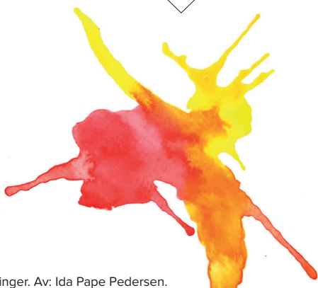
Bilde 1: Sammenfiltringer.