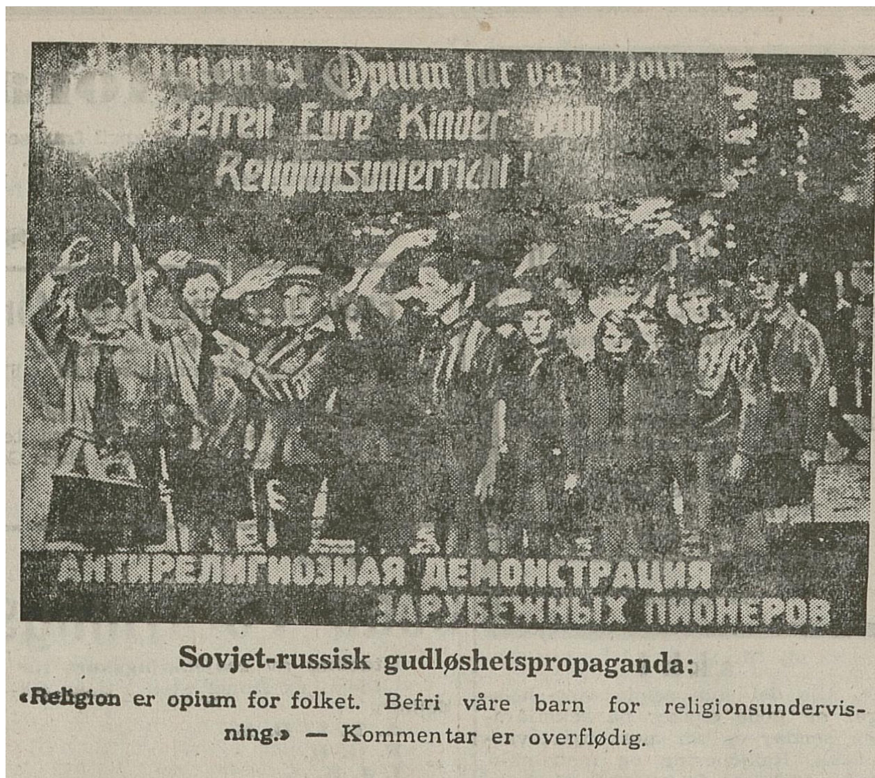
Plakat fra Np 1. april 1943. Propaganda mot Sovjetsamveldet