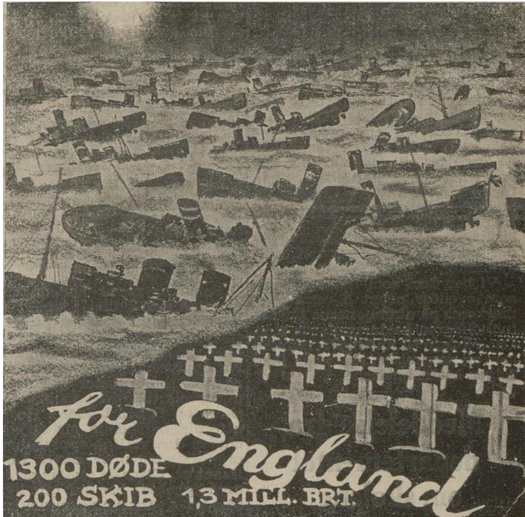
Plakaten ovenfor er fra 7. april 1942 og er koblet til en kort artikkel i Nordlandsposten fra den dagen. Plakaten illustrerer at 1300 norske sjøfolk ble offer for England, at 260 (obs. på plakaten står det 200) skip ble tapt på til sammen 1,2 millioner BRT. Av den tidligere norske handelsflåte (tapt pga England)