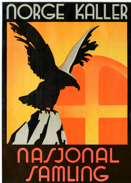
Figur 1: Norge kaller – nasjonal samling [Plakat], av Justismuseet, 2017, artscene.no

For å gjøre det klart så var det rent estetisk så var det ikke mye å skille mellom NS-plakater og Arbeiderpartiets plakater