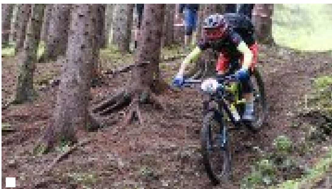
Har du hørt om Crazy Moose og Krimskrams? Nå vil de utvide tilbudet i Bodø