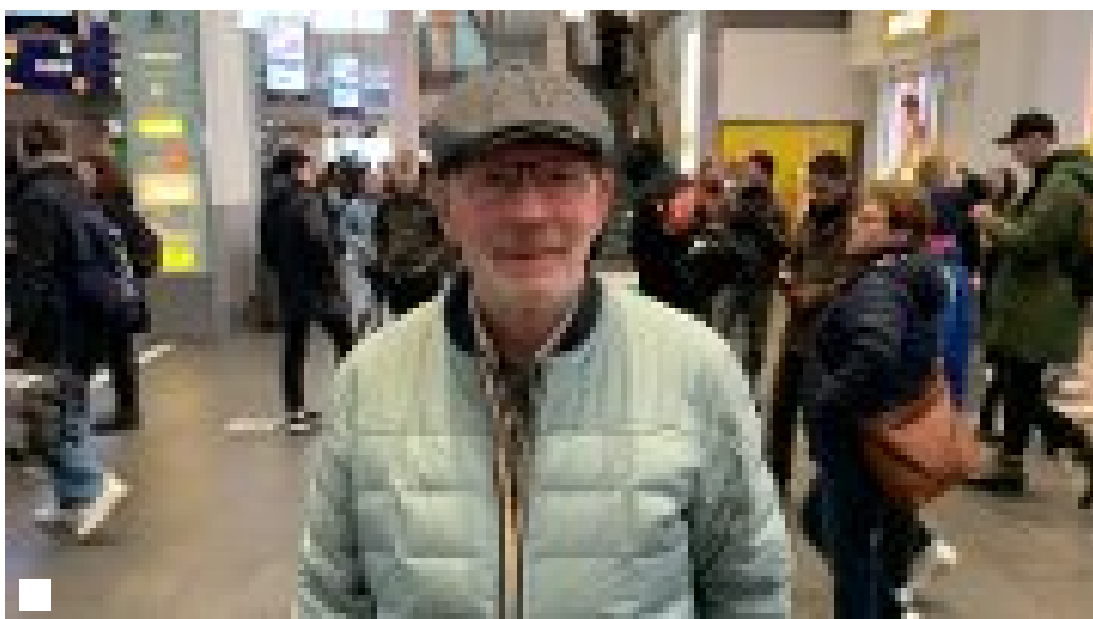
Får bakoversveis av Coop-priser: - Ikke greit i det hele tatt