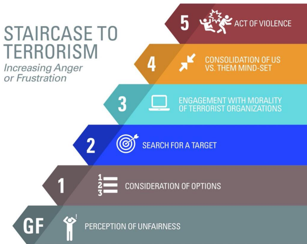
Figur 1: Moghaddams Staircase to terrorism (2005), The IACP.

( https://pbs.twimg.com/media/Die40LqX4AAOviZ.jpg )