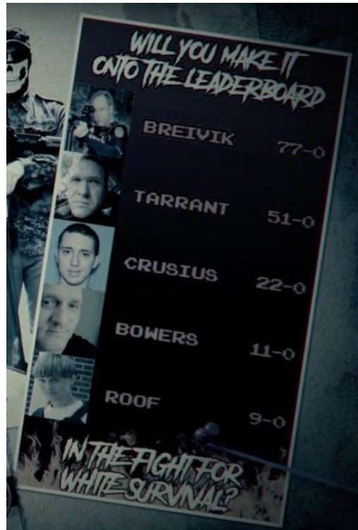
Figur 3: Leaderbord av høyreekstreme som har utført angrep (PST, 2021, 0:52).