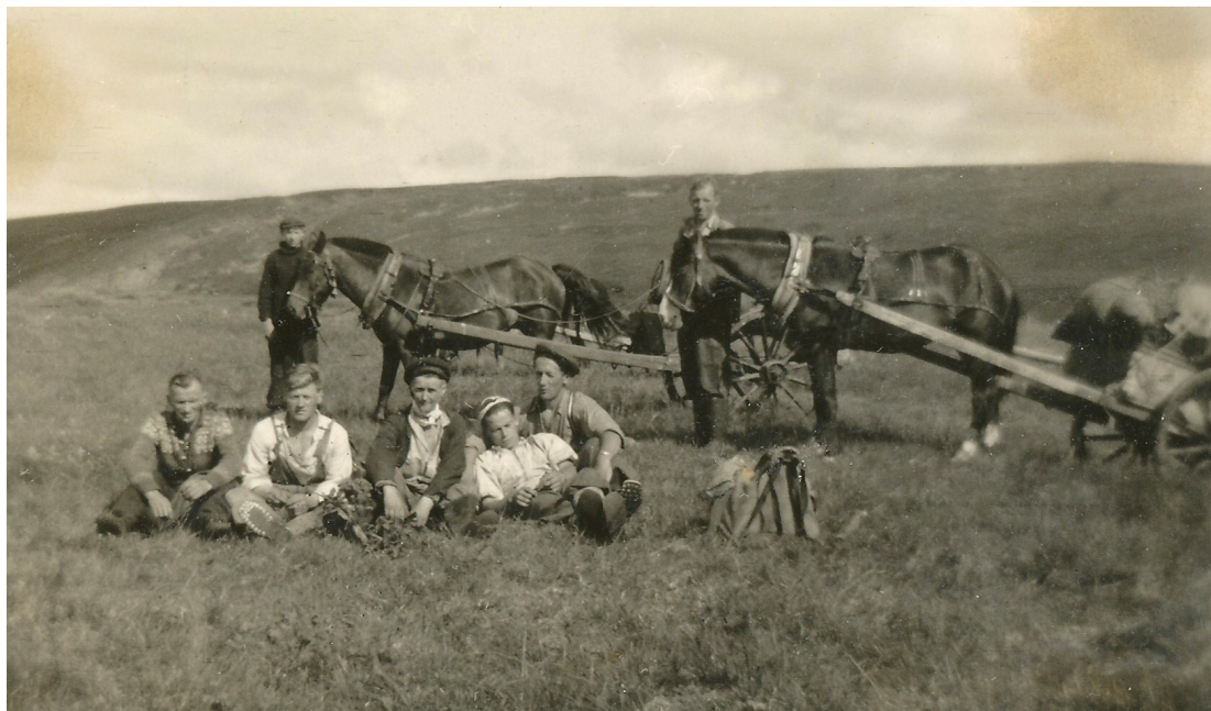
Illustrasjon 2: Hest og mennesker. Nord-Trøndelag var et fylke som lenge var preget av landbruksnæringene og småskala industri knyttet til dem: slakteri, meierier, møller og treforedling. (Harald S. Duklæts privatarkiv).

Målt i antall sysselsatte, var jordbruket i Norge i 1920 ennå landets viktigste næringsgrein, med en tredjedel av befolkninga tilknyttet. 17 Det var særlig tydelig i Trøndelag, der en stor andel av yrkesbefolkninga var sysselsatt i primærnæringene, flere enn i resten av landet. Den rike grøden skapte et grunnlag for store gårder og sosioøkonomiske forskjeller. Rundt 1920 hadde jordbruket gjennomgått en rekke endringer, blant annet ved å ta i bruk flere mekaniske hjelpemidler. Til denne mekaniseringa var det behov for elektrisk kraft til jordbrukets motordrift, som for eksempel treskeverkene. Det var dette næringslivet fylkespolitikerne i Nord-Trøndelag var opptatt av. Når det hadde fått sitt, ville det være mulig å tilgodese elektrisitet til større industrielle foretak.