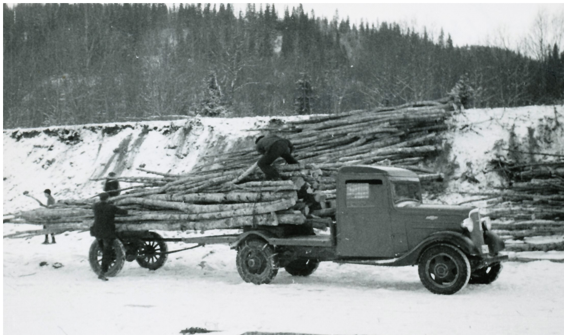
Illustrasjon 3: Lessing av older på Helgåa. Etter hvert gjorde lastebiler tømmerfløting unødvendig. Skogbruket var fortsatt viktig i Nord-Trøndelag. Her et bilde fra lessing av older i Verdal i 1939.