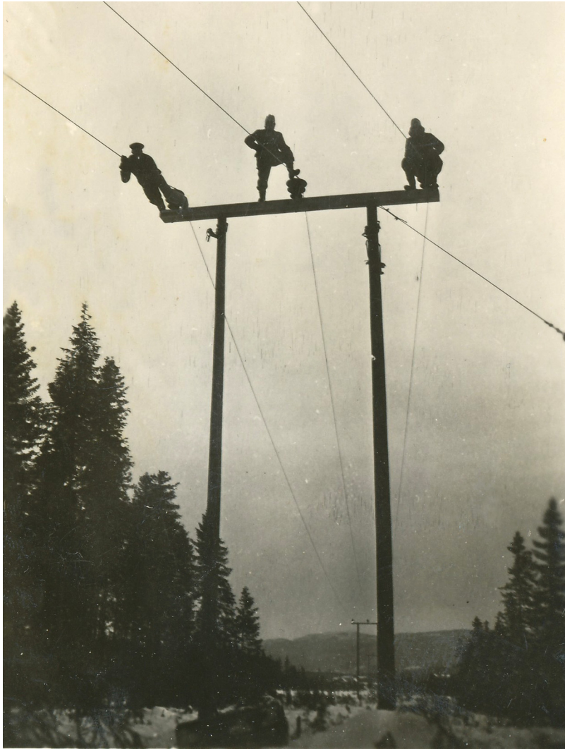
Illustrasjon 4: Menn på mastetoppen. Elektrisitetslinjene som skar gjennom Nord-Trøndelag på kryss og tvers, ble et fysisk uttrykk for viljen til sammenbinding. Bak lå mange timers arbeid for menn i hele fylket.