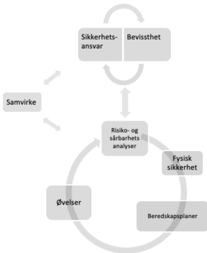
Figur 2. Beredskapsprosess i moskeer

Figur 2 viser en systematisk rekkefølge av aktiviteter som til sammen skal skape et ønsket resultat, og kan dermed betegnes som en beredskapsprosess til bruk i moskeer. Det vil innledningsvis gis en kort forklaring, før de ulike elementene vil diskuteres inngående gjennom resten av kapittelet. Beredskapsprosessen er en helhetlig tilnærming som bidrar til å øke moskeenes beredskap mot terrorangrep, og andre uventede, uønskede hendelser. Den stimulerer til en praksis som er i tråd med HRO-teoriens prinsipper for å oppnå høy reliabilitet i organisasjoner (Weick & Sutcliffe, 2015). Spesialisering gjennom etablering av sikkerhetsansvarlige grupper eller personer er det anbefalte utgangspunktet. Dette vil videre kunne øke moskeenes bevissthet, samt bruk av beredskapshevende tiltak og tilnærminger som risiko- og sårbarhetsanalyser, fysiske sikkerhetstiltak, beredskapsplanverk og øvelser. Sikkerhetsansvarlig i moskeen vil være innslagspunkt for samvirkeaktører, og omvendt.