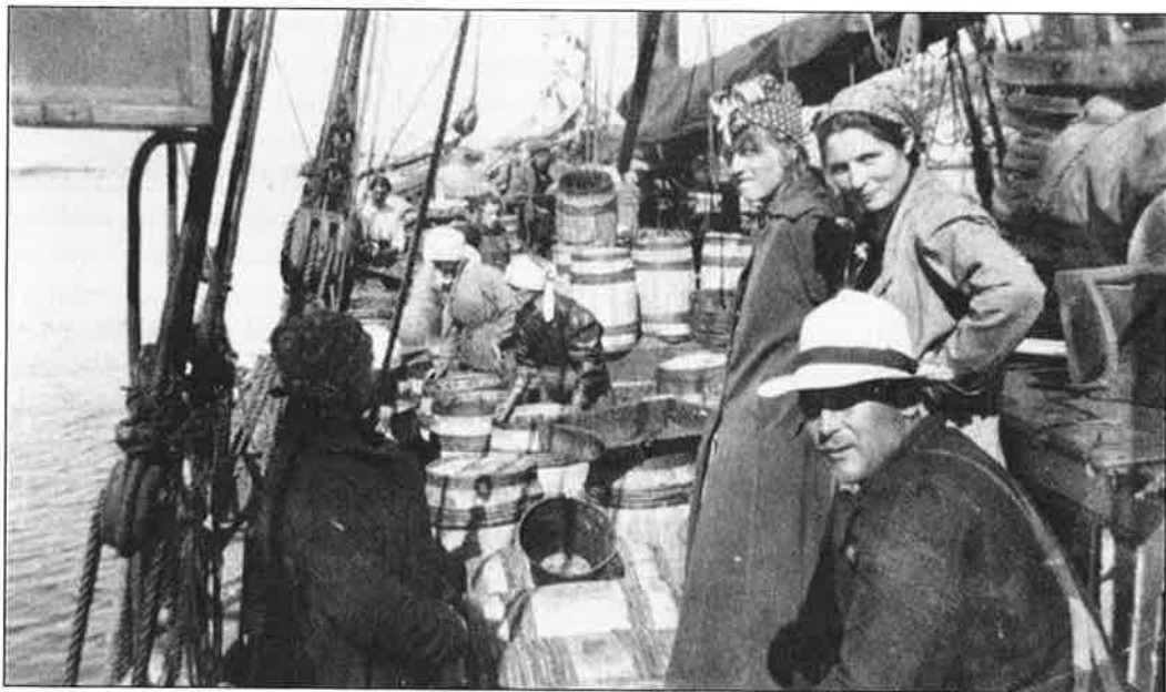
Tilvirking av sild om bord i galeasen «Mor», som tilhørte handelshuset Zahl i Nesna. Silda var basis i kystfolks byttehandel med skogsbygdene.

fortjenesten også god. Det holdt som regel fjellbonden fra å reise til Lofoten og delta i fiskeriene. 19 Trevarene bestod så vel av råmaterialer som bearbejdede produkter. Råmaterialene var først og fremst tømmer, ved og stenger til hjeller. I tillegg kjøpte kystfolk store mengder never til takteking, som var et produkt som kom fra områdene langt øst, fra den storvokste bjørkeskogen rundt Røsvatnet, nær svenskegrensen. Av foredlede produkter nevnes båter, bord, tønner, bøtter, trau, stamper, årer, auser, kar, kjevlere og rokker. I nabosognet Mo ble det først og fremst produsert store mengder båter av ulik størrelse, som kystfolk hentet. Foruten båter ble også årer og trekavler produsert her, og annet som måtte til for å utstyre båtene. Til gjengjeld kom kystfolk til Korgen og Mo med maritime produkter, i all hovedsak fiskevarer, men også egg, dun, tran og lyse.