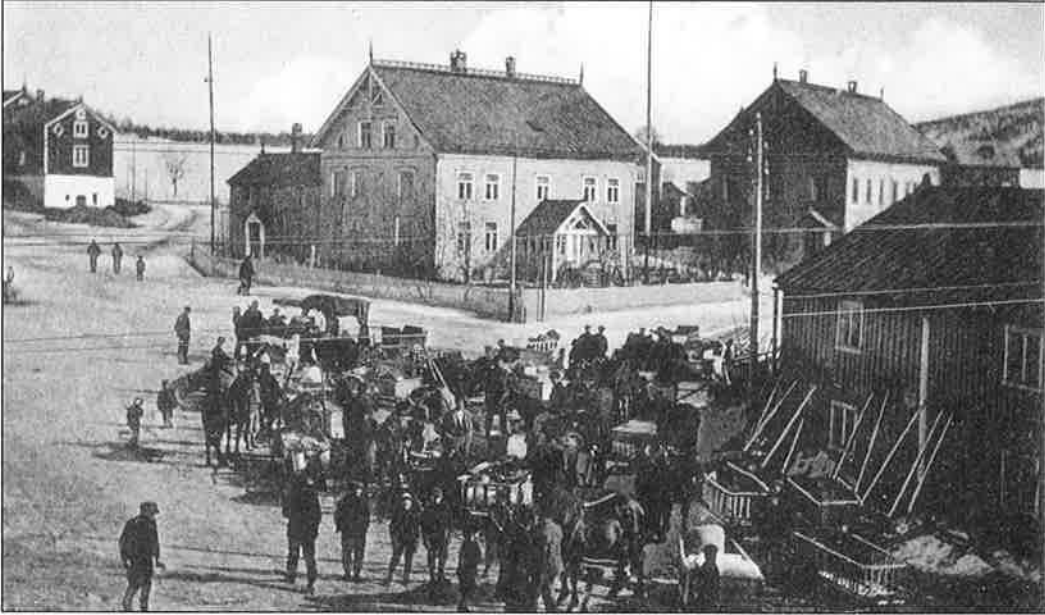
Svenske nybyggere/bønder foran svenskstallen på Gammeltorget i Mo i Rana ca. 1900.

I neste omgang ble maritime varer ført til Mo og byttet igjen mot vilt, trevarer og gardens produkter. Dermed tjente Meyer både på kjøp og salg i en treleddet strategi. 37 Han hadde da full kontroll med omsetningen og siden penger ikke tjente som objektive verdimål i denne handelen, ble skjønn og subjektive vurderinger desto viktigere for omsetningen. Den gamle byttehandelen uten penger ble altså holdt ved like og forsterket, selv om et fordyrende mellomledd tvang seg inn mellom produsent og konsument. Gjennom sin dominerende stilling i deler av Helgeland kunne Meyer la være å betale med kontanter, noe som etter alt å dømme må ha økt hans fortjeneste vesentlig. Leverandørene manglet konstant penger og ble på den måten bundet til å levere produktene til Meyer for å få til livets opphold. Selv om folk hadde tilgang til mange ressurser som ble bearbeidet gjennom eget arbeid, kunne de likevel ikke operere fritt på markedet. Den paternalistiske avhengighe-