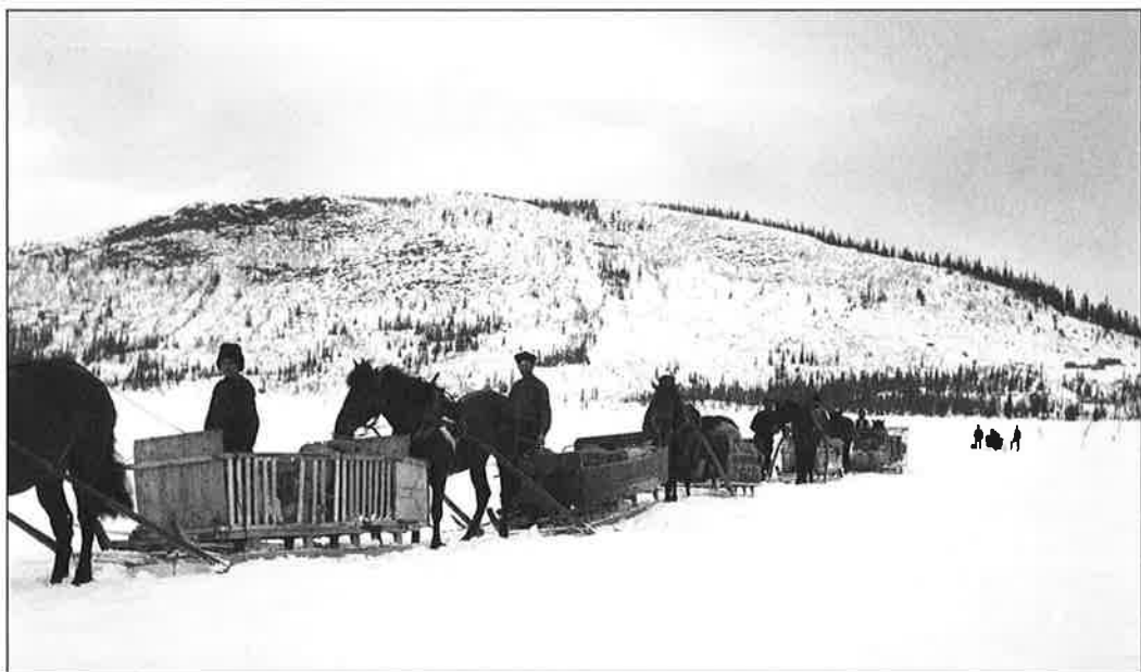
Svensker på vei fra Sverige til Mo i Rana i 1909.

mens lettere trevarer ble laget innover dalene mot fjellet. I 1870–1880-åra var båtbyggingen på topp i Rana-distriktet og da ble 600–800 båter av ulik størrelse levert Meyer årlig, som kanskje utgjorde om lag en tredjedel av alle båtene produsert i Mo. I tillegg kom trevarer av alle slag, fra møbler til råvedstenger samt tjære, never og bark. I 1860-åra var flere uår og svenske nybyggere kom i langt større utreking enn før til Mo for å skaffe varer. Mye av de medbrakte varene bestod av ulike typer vilt, særlig snarefangede ryper, som ble eksportert sørover og til andre europeiske land. I tillegg var smør, reinkjøtt, skinn, ski, snøskuffer, tønnebånd, kommager og senetråd blant vareutvalget. Enkelte år kunne opptil 40 tusen ryper og 8–10 tusen kilo smør omsettes. 39 I sum representerte dette enorme verdier for Meyer, som gjennom svenskehandelen styrket sin beholdning mye. Svenskene fikk andre varer i bytte, mens utenlandseksporten av de kolossale viltmengdene i form av fugl, skinn og pelsverk skaffet Meyer