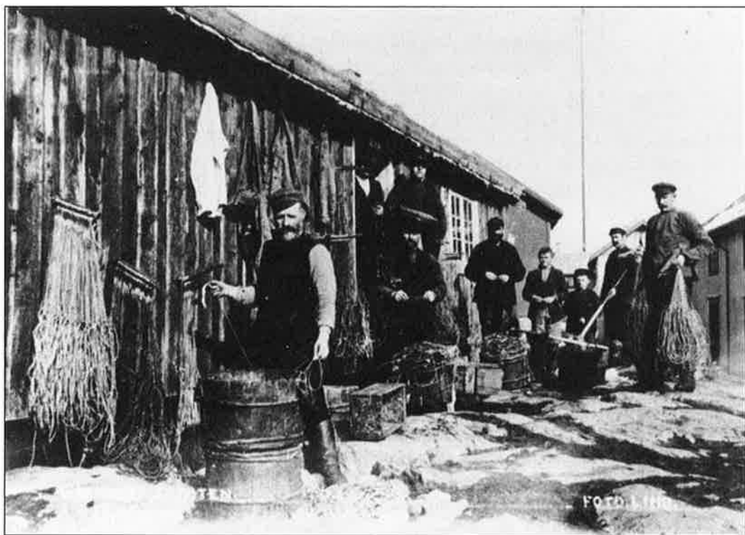
Egnebu i Lofoten.

Men virksomheten ved de nye industriforetakene ble enten kortvarig eller usammenhengende og etter noen få år ble Dunderlandsverket avvirket. I driftsperioden ble pengeøkonomien kraftig stimulert og Meyers byttehandel, som bygde på en treleddet strategi, kunne ikke få det samme omfanget som før. I tillegg ble svenskehandelen sterkt begrenset etter 1915, siden toll ble innført på varer som passerte grensa. Først på 1900-tallet gikk også båtbyggingen kraftig ned i Rana-området, blant annet som en følge av rekrutteringen til industriarbeid og en begynnende motorisering av fiskeflåten, som krevde nye båttyper. Andre distrikter som Elsfjord og Korgen holdt likevel stand og økte til og med sin omsetning av båter fra ca. 1920. 50 Mindre foretak vokste da fram lokalt, som stod for omsetningen mellom kyst og innland. Mye