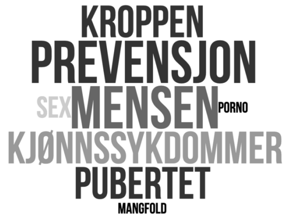
Figur 4.2.1 Ordsky av temaer elevene husker de har lært om i seksualitetsundervisningen.

Dette var noe både jentene og guttene viste interesse for å lære mer om, og kommer tydelig frem i figur 4.2.2.