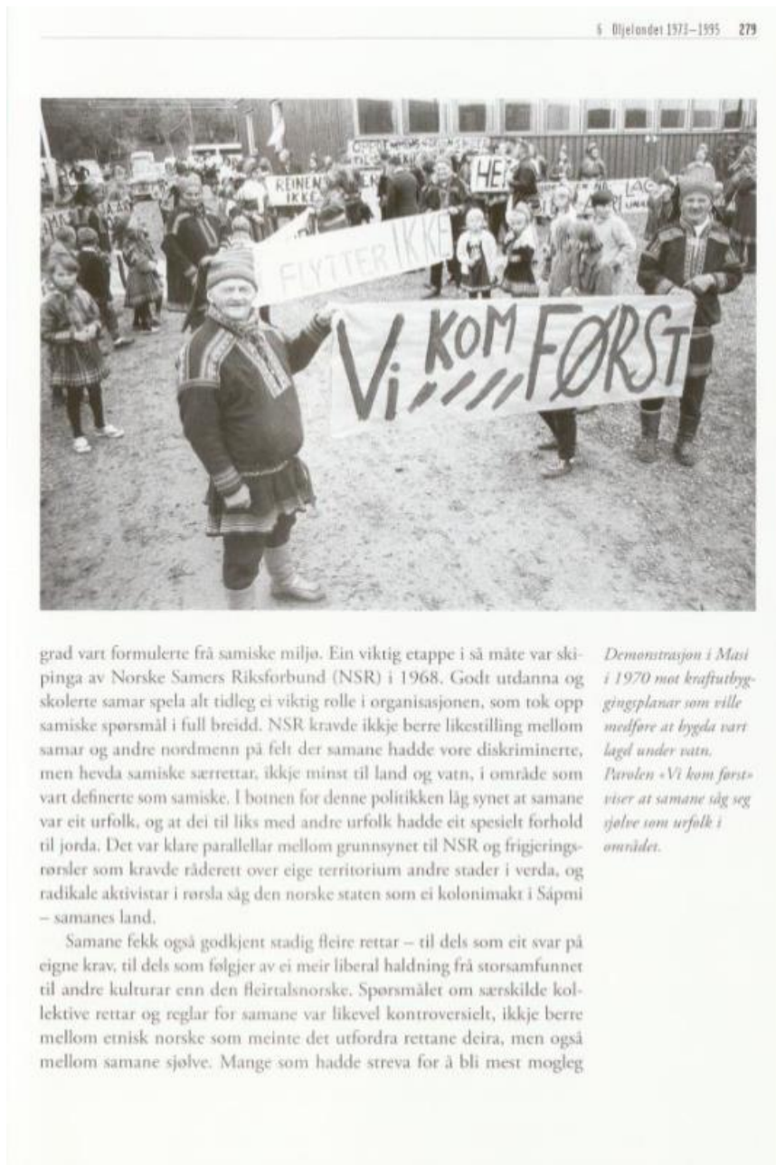
Faksimile 5: Samer i protestaksjon mot Stortingets vedtak om kraftutbygging i Alta-Kautokeino vassdraget. 412

Læreboka forklarer også hvordan konfliktene omkring utbyggingen av Alta-Kautokeinovassdraget utgjorde et vendepunkt i samens historie. 410 Det forklares hvordan konflikten rundt utbyggingen atter en gang bidro til å aktualisere debatten om hvem som skulle ha råderett over landområder i samisk område. 411 Stugu viser hvordan samene innleder protestaksjoner mot statens utbyggingsplaner, men også hvordan disse gir resultater, i form av anerkjennelse fra staten og at de nedsetter et utvalg for å jobbe for gruppens rettigheter.