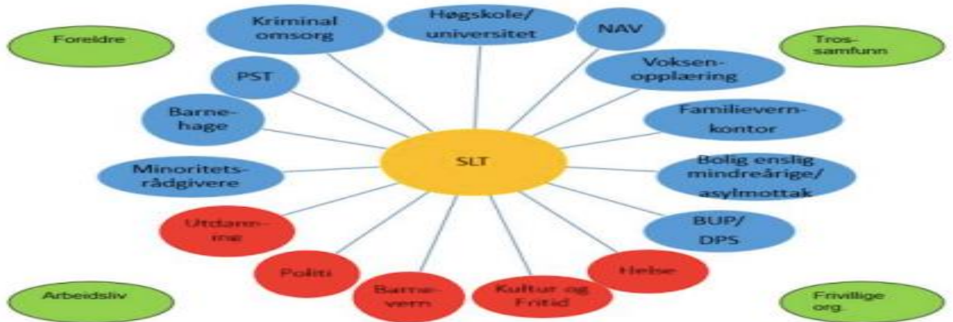
Figur 5: Relevante samarbeidsaktører i radikaliseringsarbeidet (Lid et al., 2016, s. 113).

Publikum, som er våre samfunnsborgere blir sett på som en av de fremste og viktigste samarbeidspartnerne politiet har. De sitter på masse informasjon som de muligens ikke forstår viktigheten av at politiet får kjennskap til. Publikum hører og ser mye i et lokalmiljø, og de kan på den måten være med på å bidra til å forhindre og forebygge at mennesker blir radikalisert. Dette kan de gjøre ved uformell sosial kontroll. Uformell sosial kontroll er den kontrollen et enkeltindivid utøver overfor mennesker som står en nær. I alle samfunn vil uformell sosial kontroll foreligge.