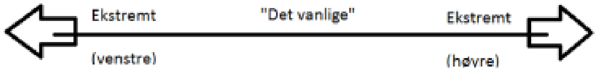
Figur: Hentet fra Gule, 2012, s. 16.

riktige sett ut ifra hva samfunnet mener er riktig i normativ forstand. Det som befinner seg på ytterpunktene blir definert som det ekstreme