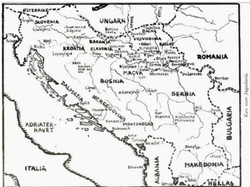
Kart over Jugoslavia. Tegnet av Nikola Rokić, 1961. Hentet fra Jugoslavia mitt land , 184.

Jugoslavia med flere land involvert, har en historie som går langt tilbake i tid noe som også har påvirket mye av Jugoslavias historie lenge etter andre verdenskrig. Basert på masteroppgavens lengde, vil jeg ikke gå dypt inn i Jugoslavias historie, men heller trekke frem det som er relevant å vite for å kunne forstå hvem de jugoslaviske krigsfangene var, samt hvorfor de ble krigsfanger under andre verdenskrig. Jugoslavia er en stat som ikke lengre finnes i 2023. Det som er spesielt danningen av staten Jugoslavia, er at det var med en samling av flere andre stater. Som vi kan se på kartet her, hvor omrisset av Jugoslavia er gjort med prikkete linje, kan vi se at det var mange andre stater innenfor Jugoslavias grenser.