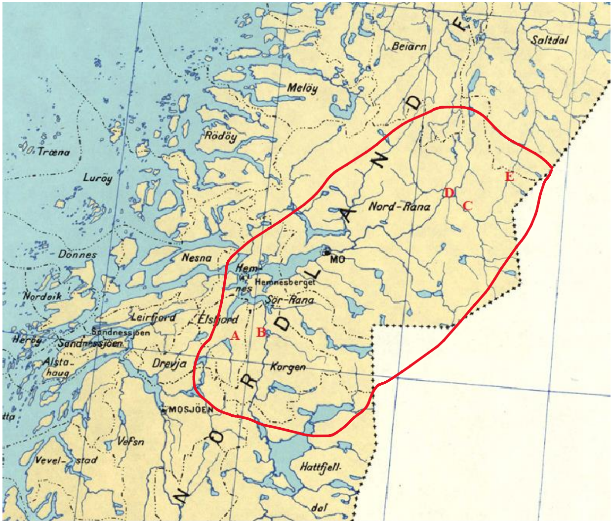
Herredskart over Nord-Norge. Utgitt av Norges geografiske oppmåling , 1918. Her markert rødt rundt ca. avgrensingsområdet «Indre Nord-Helgeland». De røde bokstavene markerer de ulike leirene (se leir-liste i teksten).