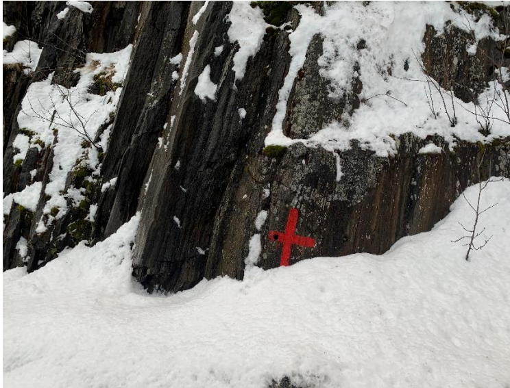
Blodkorset à 2023. Bildet tatt av undertegnede 26.02.2023.